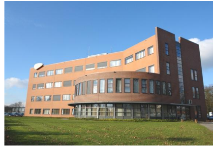
Gebouw B, E en Y

In het overzicht kunt u uw bestemming opzoeken. Achter de bestemming staat het nummer van de parkeerplaats (P1 t/m P5) en het gebouw.